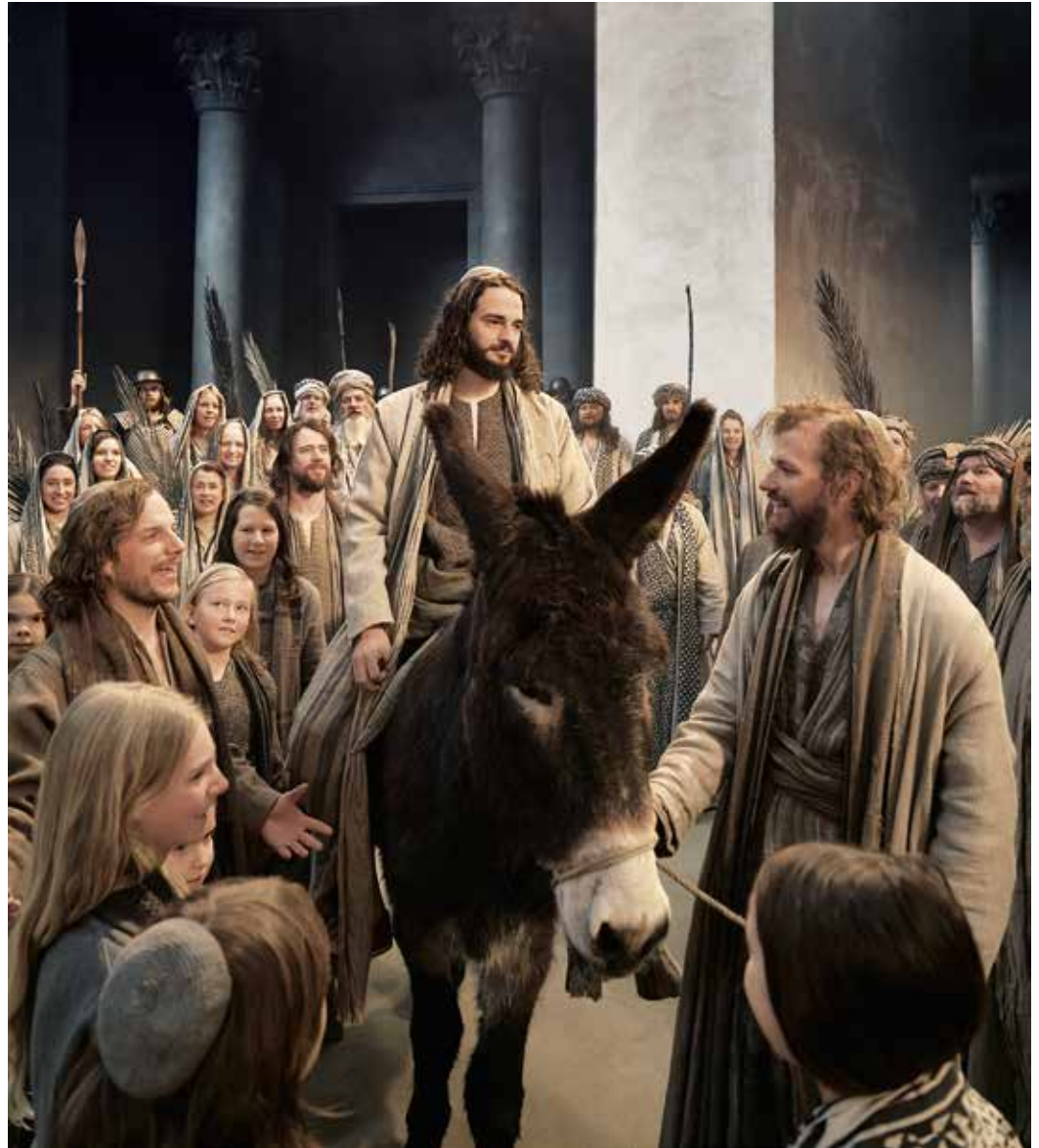
Einzug in Jerusalem

Veranstaltungsort und weitere Details sind dem noch folgenden Aushang im Passionstheater zu entnehmen.